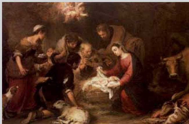
The adoration of the shepherds , Bartolomé Esteban Murillo, 1668, London, Wallace Collection

A celebração da festa de Natal acontece em um contexto social, onde a alegria da encarnação do Verbo de Deus, Jesus Cristo, que nos renova e salva, será festejada em um clima de um Brasil de perplexidades e incertezas. Certamente teremos um Natal mais austero no consumo e nos gastos, porém, um pouco mais próximo da simplicidade e da austeridade do presépio.