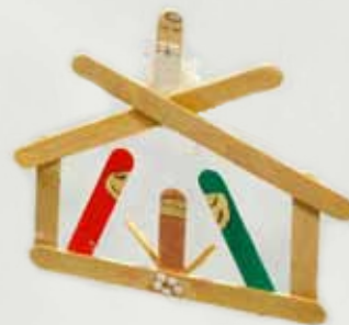
Enfeites de rolo de papel higiênico, árvore e anjo de revistas, bola de natal de retalhos e presépio de palito de picolé - Jornal da PUC